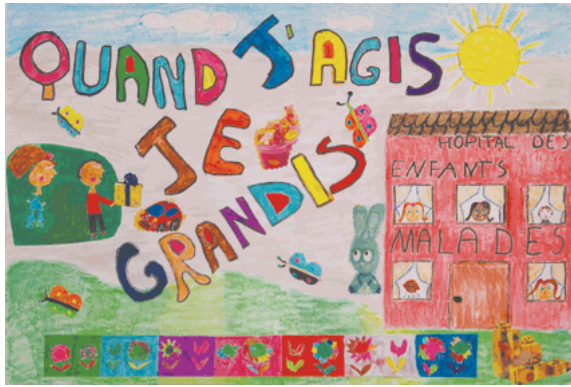
“Quand j’agis, je grandis” Centre de loisirs maternel Bois Perrier (Rosny sous Bois – 93)