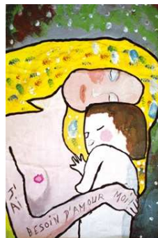
Détail des « 3 âges de la vie » de Klimt (1905) revisité par le Centre de loisirs Majorque de Perpignan (66) en 2005.