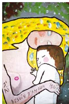
Détail des « 3 âges de la vie » de Klimt (1905) revisité par le Centre de loisirs Majorque de Perpignan (66) en 2005.