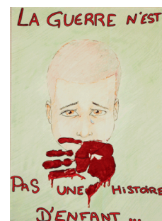
"La guerre n'est pas une histoire d'enfant" Les Francas d'Ile de France / Approfondissement BAFA