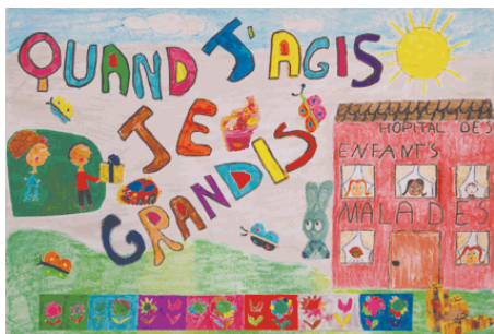
"Quand j'agis, je grandis" Centre de loisirs maternel Bois Perrier (Rosny sous Bois – 93)

Il peut être intéressant de s'appuyer sur des Ateliers Slam ou sur des ateliers d'écriture pour "fabriquer" les titres.